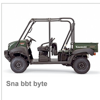
Sna bbt byte

* Rekommenderat cirkpris inklusive 25 procents moms. Priserna kan ändras utan avisering.