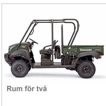
Rum för två