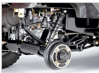
Styrka och komfort