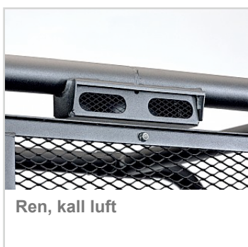
Ren, kall luft

* Rekommenderat cirkapris inklusive 25 procents moms. Priserna kan ändras utan avisering.